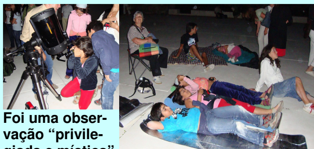
Foi uma observação “privilegiada e mística”.

Mas não ouviram apenas, também observaram, a olho nu, algumas dessas “estrelas cadentes” e, através do telescópio viram o mesmo que Galileu: Júpiter e as suas quatro luas.